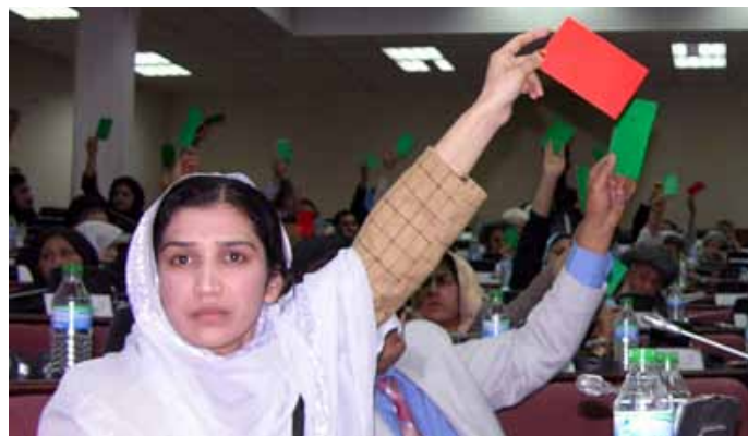
27 pct. af medlemmerne af det afghanske parlament er kvinder.

På den internationale ministerkonference i London den 28. januar 2010 blev der taget en række skridt for at etablere en ny og styrket international koordinationsstruktur. Tre centrale koordinationsposter, FN’s senior civile repræsentant (chef for UNAMA), NATO’s senior civile repræsentant og en ny