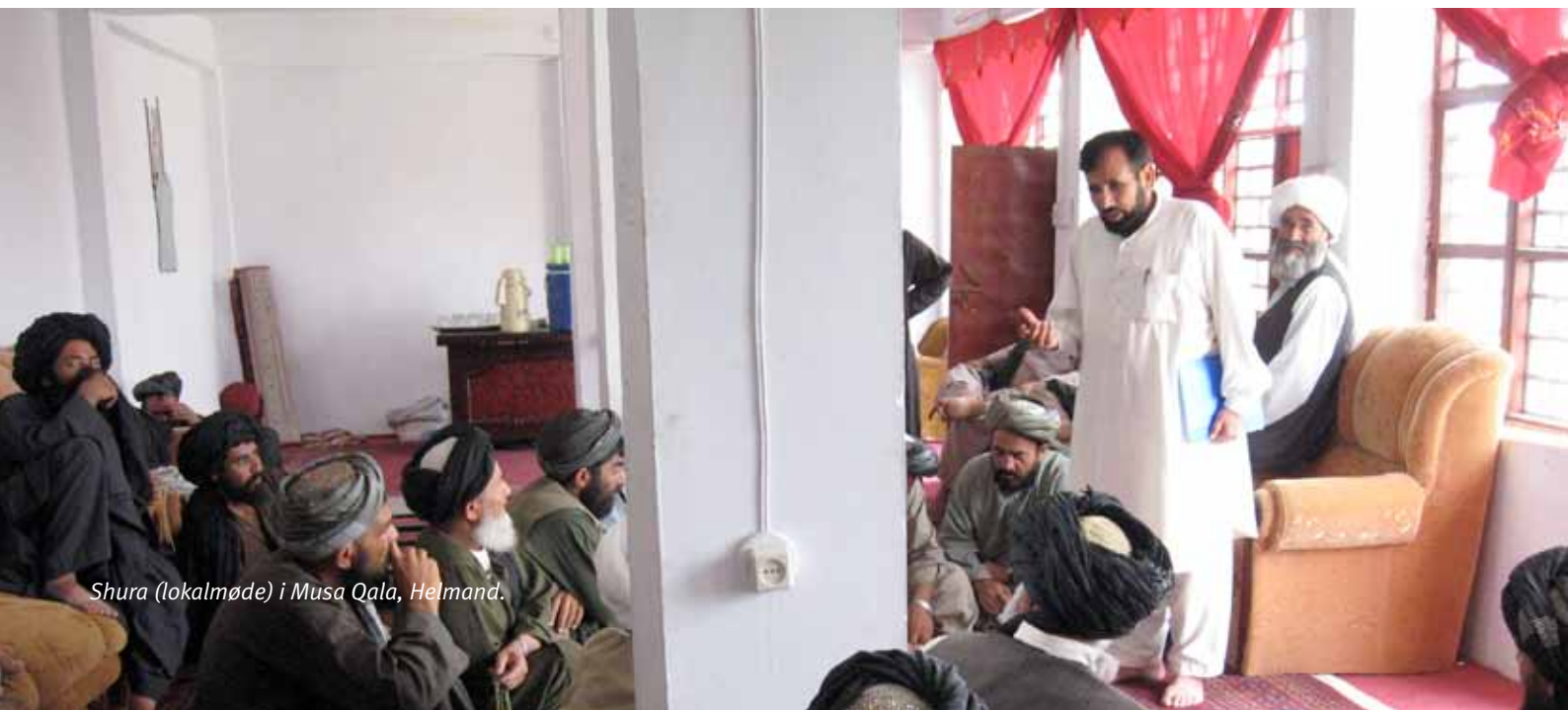
Shura (lokalmøde) i Musa Qala, Helmand.

lokale udviklingsprocesser. Det er planen, at NSP-programmet skal udbredes til flere områder i Helmand i 2010. Det har ikke hidtil været muligt på grund af sikkerhedssituationen. Gennem NSP opbygges lokale udviklingsråd i landsbyerne. De har vist sig at være en væsentlig mekanisme til at inddrage befolkningen i udviklingsprocesserne og til at skabe lokalt ejerskab. Det er også en kanal for dialog helt fra regeringen til lokalniveauet om det, der virkelig betyder noget for befolkningen: serviceydelser og positiv rammeskabelse for den privatøkonomiske aktivitet. Det er afgørende for at bringe udvikling ud til lokalområderne og derved modvirke oprørernes indflydelse.