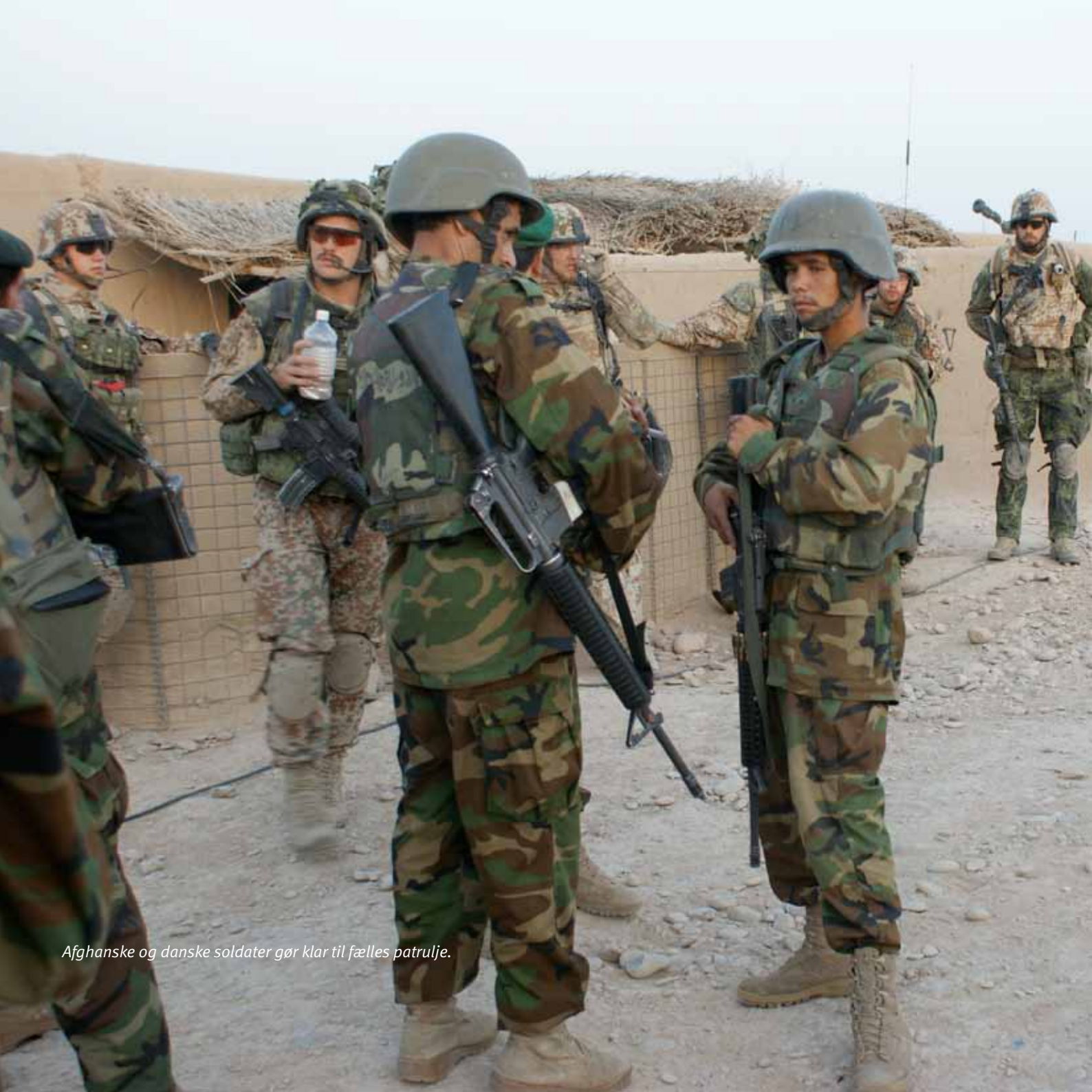
Afghanske og danske soldater gør klar til fælles patrulje.