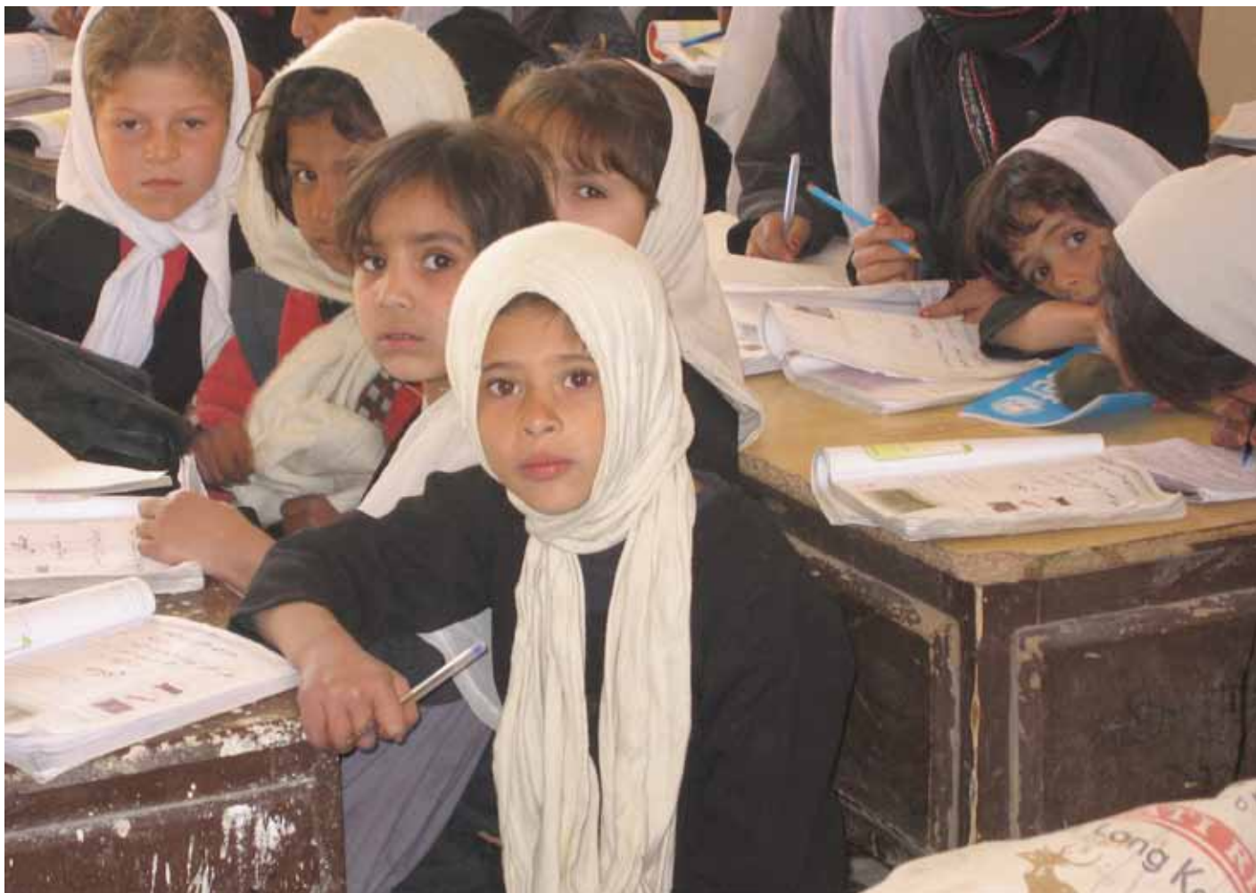
Pigeskole i Lashkar Gah i Helmand. Syv mio. børn går i dag i skole, heraf er mere end to mio. piger.