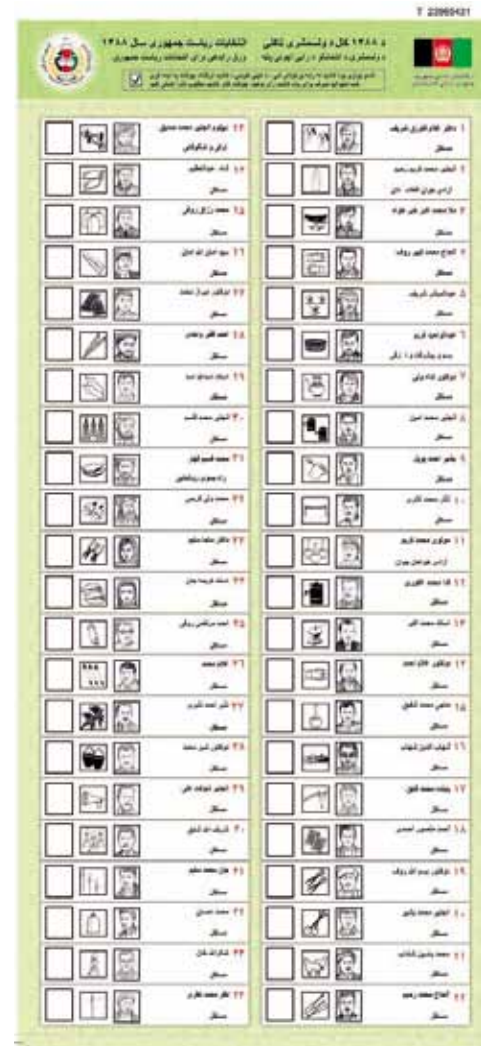
Stemmeseddel til præsidentvalget