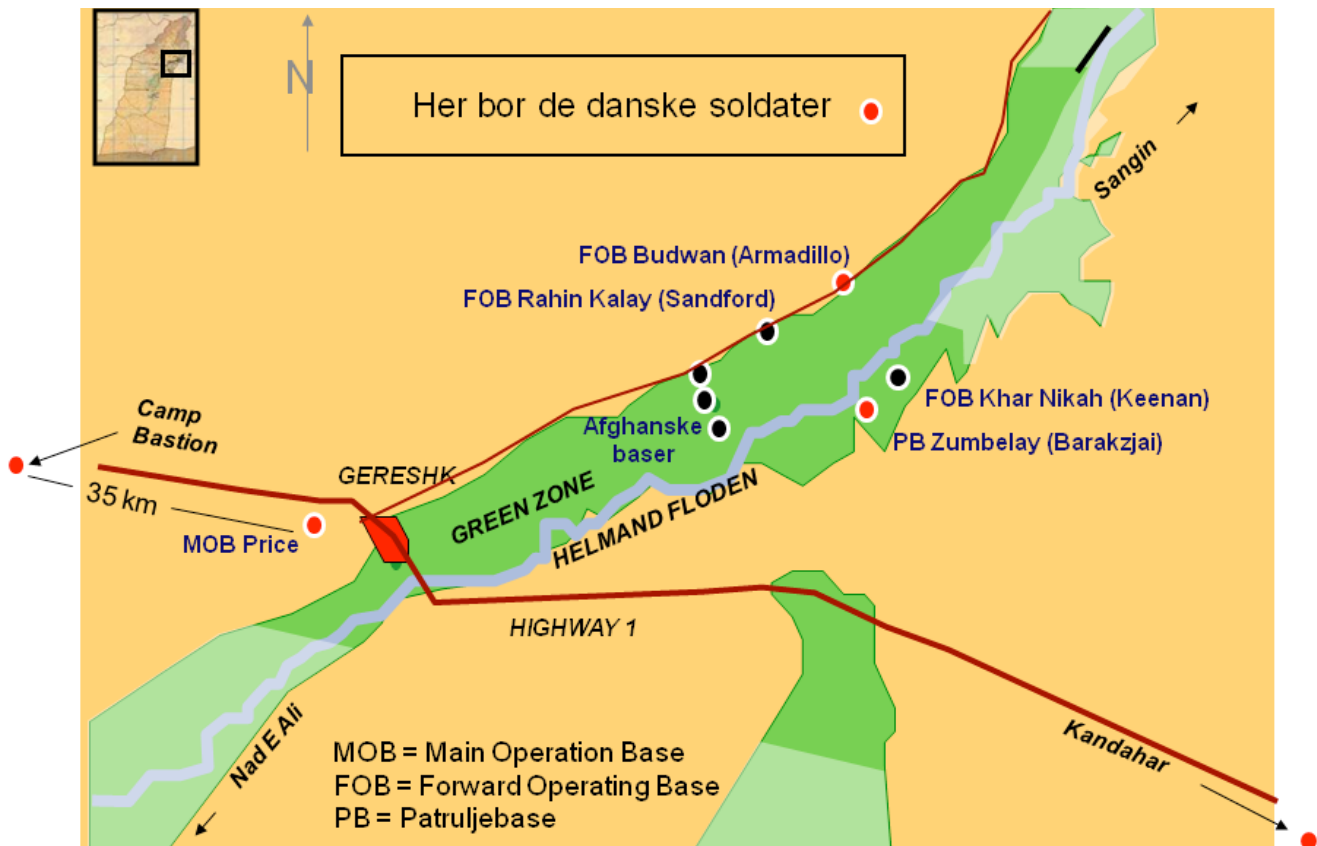
Oversigt over dansk indsættelse på baser den 31. december 2009