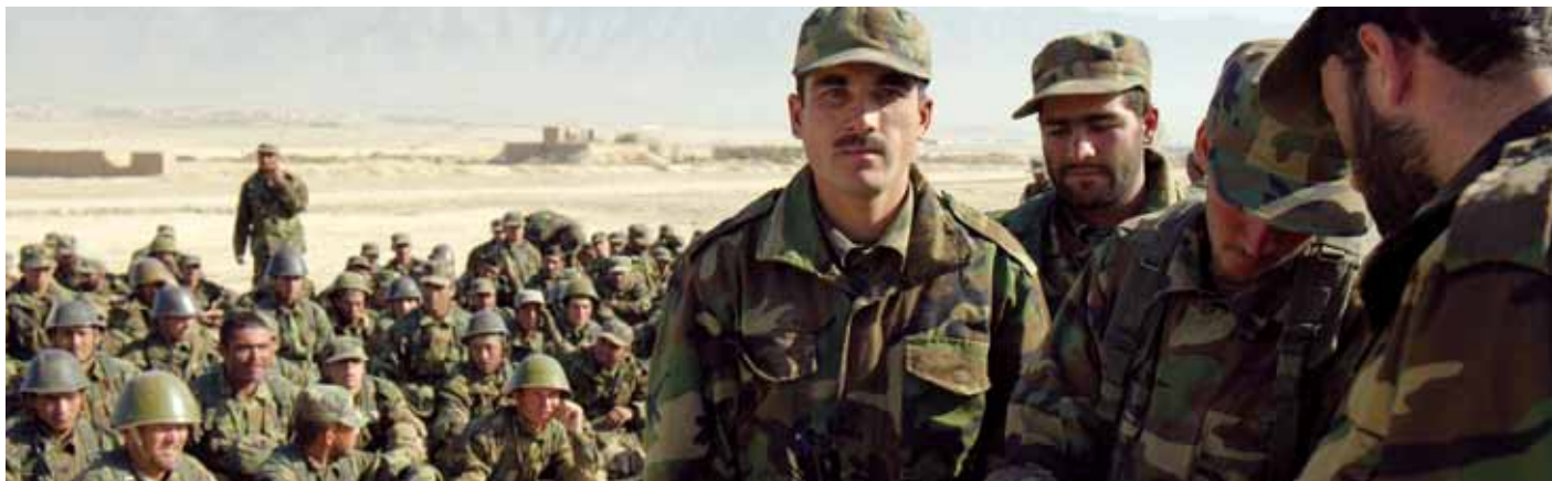
Den afghanske hær er vokset fra ca. 80.000 soldater i 2008 til over 100.000 soldater. Målet er at nå 171.600 soldater inden oktober 2011.

I 2010 forventes nye afghanske enheder at tilgå Helmandprovinsen. Disse, eller eventuelt andre tilstrækkeligt uddannede afghanske enheder, forventes på sigt sammen med det afghanske politi at skulle overtage sikkerhedsansvaret fra den danske kampgruppe. En bataljon (kandak) er allerede ankommet til Helmand-provinsen. Den består af tre infanterikompanier, et støttekompagni samt et stabskompagni med i alt ca. 500 mand. Den danske kampgruppe og kandakken har etableret tæt kontakt og koordinerer de indledende skridt mod etablering af et tæt partnerskab. Kandakken forventes trinvis at blive