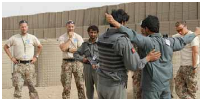
Polititræning i Helmand.

Kapacitetsopbygning af politiet i Helmand er en særlig udfordring. Der er i øjeblikket 3.200 politifolk til tjeneste i Helmand, hvilket planlægges forøget til ca. 5.100 i 2010. Politiet løfter en relativt stor del af sikkerhedsopgaven, mens den afghanske hær langt fra er til stede i det nødvendige omfang. Et væsentligt problem er, at politistyrken i Helmand udhules med 59 pct. hvert år, herunder med 10 pct. dræbte og 17 pct. sårede. Et af de helt store problemer er derfor at fastholde politifolkene, ikke mindst de mest egnede. Et andet problem er, at kun ca. 10 pct. af den nuværende styrke har gennemgået egentlig polititræning. Britiske og amerikanske styrker i Helmand gennemfører nu otte ugers grundlæggende polititræningskurser (Directed District Development (DDD) for nye rekrutter og Focussed District Development (FDD) for eksisterende politifolk) i to midlertidige træningscentre. EUPOL har støttet DDD-træningen og overvejer sin fremtidige rolle inden for dette område. Pakken omfatter både grundlæggende polititræning og egentlig kamptræning. Ambitionen med DDD er at kunne træne op til 400 politifolk hver anden måned (i realiteten formentlig færre, da nyrekruttering er et problem). Men der er behov for nye, permanente polititræningscentre i Helmand. Derfor opbygges nu sådanne to centre, ét af US i Camp Leatherneck og ét af Danmark og UK i Lashkar Gah. Centrene skal forestå det otte uger lange grundtræningskursus for politirekrutter, men også undervisning i mere avancerede