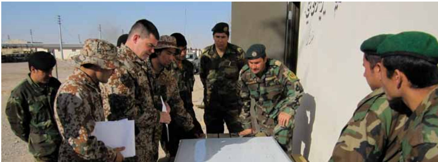
Fælles planlægning af bevogtningsopgaver med afghansk garnisonsenhed ved det danske garnisons-OMLT i Helmand.

OMLT under dansk kommando vil således etablere de nødvendige forudsætninger for kapacitetsopbygning af den afghanske bataljon.