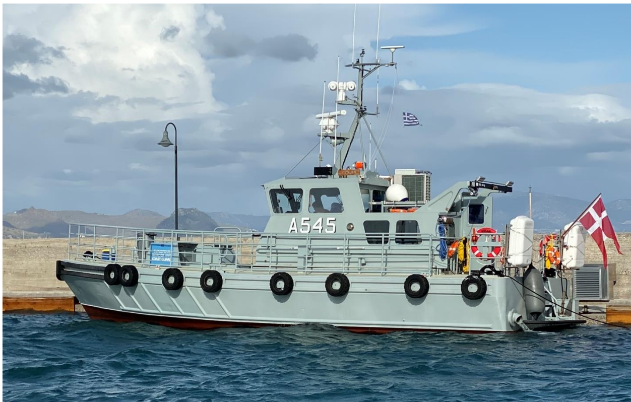
FRONTEX-fartøj A545.

De tre fartøjer til Marinehjemmeværnet blev officielt overdraget til operativ tjeneste den 10. november 2019.