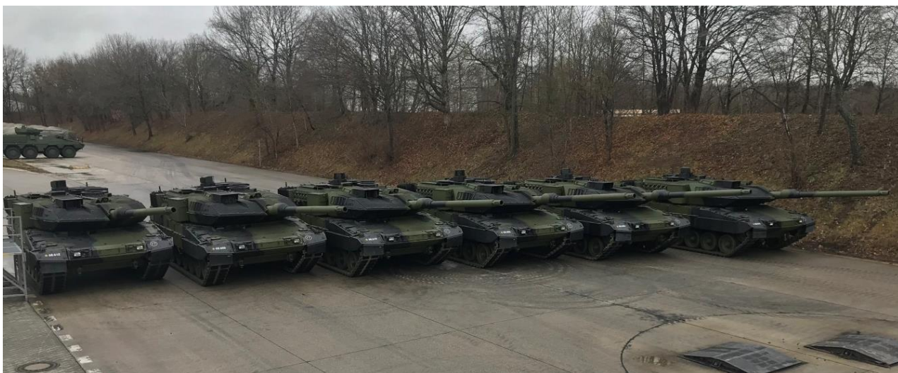
Opgraderede kampvogne Leopard 2 A7.

Kampvognen har under opgraderingen blandt andet fået ny kanon og opgraderet ildledelsessystemet, natsigtemidlerne, pansringen, minebeskyttelsen og motor-gearkassepakke. Med det har kampvognen mulighed for at ramme mål hurtigere, mere præcist og på større afstand end tidligere og med en bedre bevægelighed i terræn. Som følge af de opgraderede og renoverede komponenter er kampvognen blandt de mest moderne i verden.