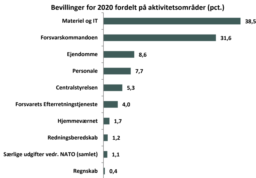
Tabel 2: Oversigt over Forsvarsministeriets bevillinger i 2020 fordelt på aktivitetsområder (pct.)