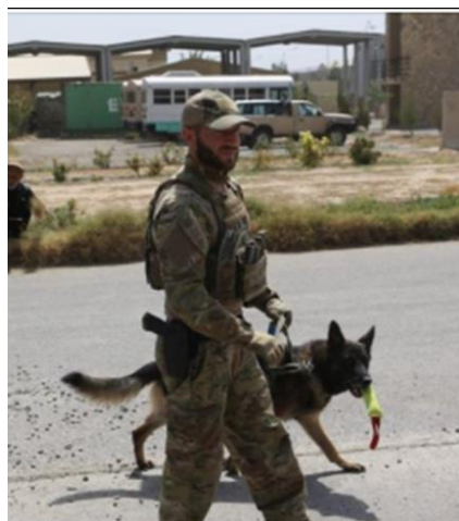
Militær arbejdshund med hundefører under skarp indsættelse i Resolute Support Mission i Afghanistan.