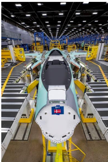
Det første danske F-35-fly, med halenummeret L-001, på produktionsbåndet.

Endnu en milepæl blev nået den 15. juni 2020, da første spadestik blev taget til bygningen, som skal huse de nye F-35-kampfly på Flyvestation Skrydstrup. Anlægsloven om udbygning og drift af flyvestationen var en forudsætning for at byggeriet kunne begynde. Den 11. juni 2020 vedtog Folketinget anlægsloven, og det juridiske grundlag for byggeriet kom således på plads. Med vedtagelsen af anlægsloven trådte den politiske aftale om at kompensere ca. 1.600 boliger i Flyvestation Skrydstrups nærområde også i kraft.