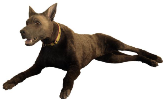
Traumehund af typen TraumaFX K9 DIESEL – Meget realistisk i udseende, men spækket med elektronik.