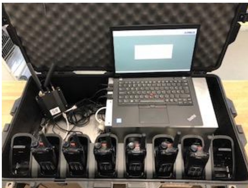
Kuffert med SINE-radioprogrammeringsudstyr.

TAQTO-projektet bidrager til at styrke samarbejdet på tværs i forsvaret, hvor brugere og eksperter arbejder sammen om at implementere nyt materiel og samtidig genbruge tekniske løsninger og udnytte eksisterende intern ekspertise.